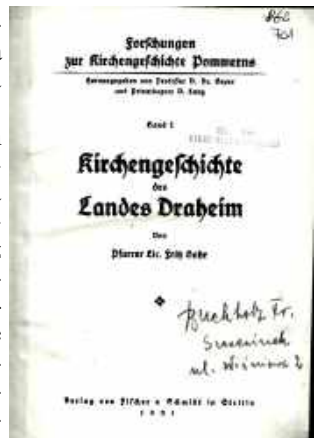
3. Strona tytułowa książki F. Bahra z Siemczyna.