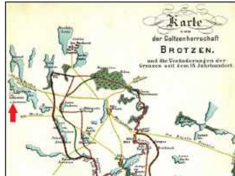
2. Fragment mapy posiadłości Goltzów z opracowania G. Brümmera.

Nazwa Miłkow została umieszczona przy nazwisku Brümmera również na stronie tytułowej jego opracowania z 1886 r. pt. „Ueber die alten Ortsnamen der Gegend bei Deutsch Krone und Tempelburg” (niem.: „O dawnych nazwach miejscowości okolic Włocławka i Czaplinka”).