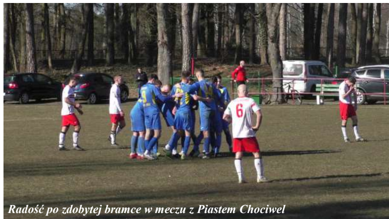
Radość po zdobytej bramce w meczu z Piastem Chociwel