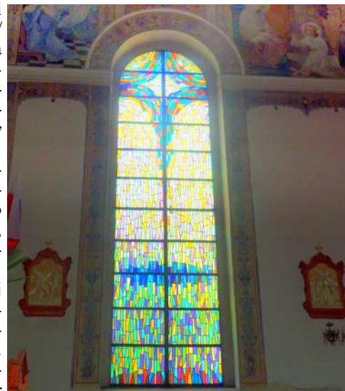
6. Witraż w oknie skrzydła z ołtarzem trzech krzyży (fot. Zb. Januszaniec, 2021 r.).

Opisana wyżej sprawa była już w przeszłości przedmiotem mojego zainteresowania. W swojej zagadce historyczno-krajoznawczej nr 35 opublikowanej 20.02.2012 r. na Drzewskich Stronach Internetowych w dziale „Odkrywcy” napisałem między innymi: Wiele osób zadawało nieraz pytanie: dlaczego z czaplineckiego kościoła zostały w 1992 roku zdemontowane wszystkie trzy dzwony? Ja też takie pytanie zadalem 20 lat temu ówczesnemu proboszczowi czaplineckiej parafii. Otrzymałem odpowiedź, którą dziś wszyscy znamy: chodziło o odciążenie mocno osłabionej konstrukcji stropu kościoła. Poznałem wtedy również kilka szczegółów, o których nie wszyscy wiedzą. Otóż, według oceny fachowców konstrukcja kościoła była osłabiona przez upływ czasu do tego stopnia, że w przypadku zaniechania radykalnych zabiegów ratunkowych, strop mógł grozić zawaleniem. Słabym miejscem kościelnej konstrukcji – wg relacji ówczesnego proboszcza – był środek kościelnego stropu, gdzie krzyżują się dwie główne belki stropowe (których układ widoczny jest dla osoby znajdującej się wewnątrz świątyni). Dowiedziałem się, że nad skrzyżowaniem tych belek, na poddaszu kościoła wznosi się pionowy drewniany słup, na którym wspiera się znaczny ciężar przenoszony przez belki wieży dachowej. Znajdująca się na poddaszu dzwonnica, z trzema ciężkimi dzwonami, dodatkowo obciążała strop stwarzając zagrożenie dla całości konstrukcji. Słabymi punktami konstrukcji stropu były też miejsca, w których końce głównych belek stropowych wsparte są na murach