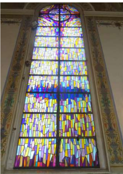
5. Witraż w oknie prezbiterium.