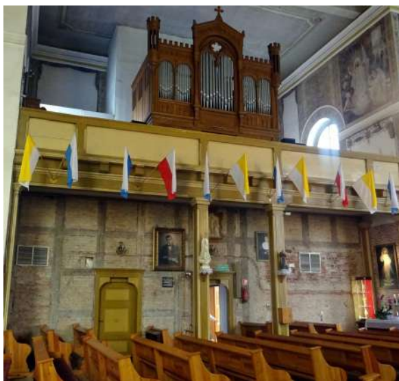
4. Pozbawiona tynku ściana pod emporą organową (fot. Zb. Januszaniec, 2021 r.).

Z oknami związana była jedna z najtrudniejszych operacji technicznych przeprowadzonych w dużym kościele. Działo się to w 1992 r. Tak opisuje to parafialna kronika: /.../ ...konieczna wymiana okien na szczytach czterech ramion kościoła Podwyższenia Krzyża Świętego była okazją do rozmontowania dzwonnicy z trzema dzwonami. Była już od dłuższego czasu niewykorzystana ze względu na osłabiony strop. Przeprowadzono tę trudną operację wg wskázówek pracowników WSI z Koszalina, którzy zbadali drewnianą konstrukcję stropu