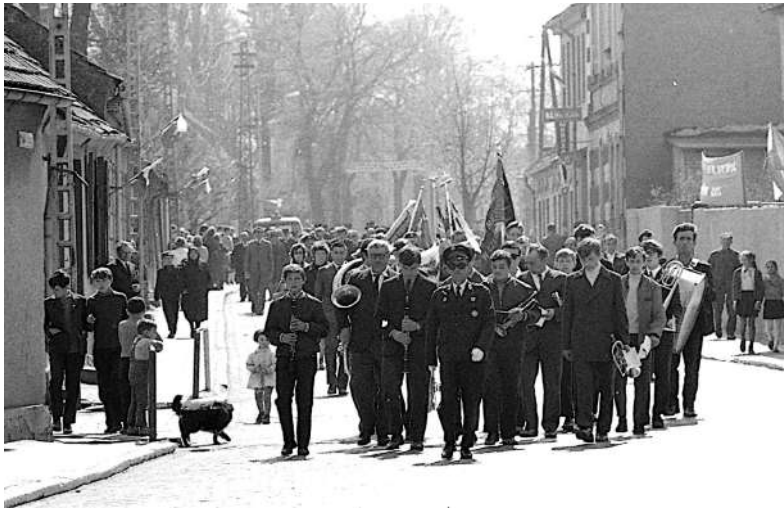
Pochód 1-majowy - dęta orkiestra strażacka

Wywodzę się z tego pokolenia, które urodziło się jeszcze przed II wojną światową. Pamiętam pokolenie powojenne, które odbudowywało Polskę, na ogół nie pytając ile im za to zapłacą. Kraj się rozwijał, ludzie naturalnie walczyli o coś, o życliwość, pomoc jeden drugiemu, zaangażowanie w sprawy najbliższego otoczenia. Dzisiaj nie ma tego prawie wcale. Brakuje mi nawet tych czynów społecznych, może ktoś kiedyś to opisze, ile nasze miasto na tym zyskało. W mediach o PRL mówi się tylko to co było złe. Starsi powinni pamiętać tanią kulturę, książki, naukę, kolonie i wczasy, tanie budownictwo mieszkaniowe, większą dostępność do lecznictwa, nie mówiąc