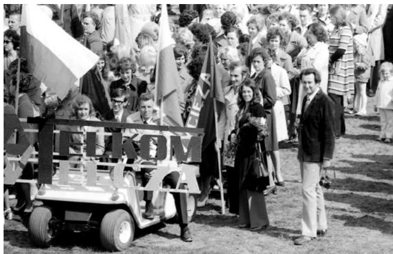
Zbiórka przed pochodem 1-majowym - I połowa lat 70-tych.

biorą niechętnie. Bez tego, co oni dla nas zapracują, niemożliwe staną się niektóre świadczenia socjalne, 13 i 14-tki itp.