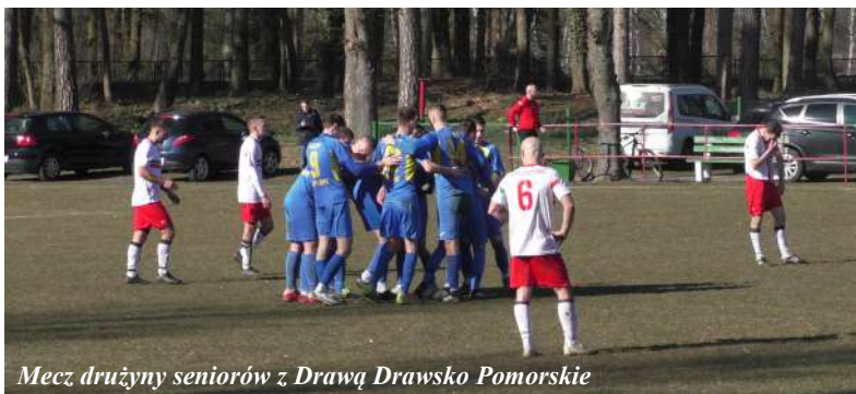
Mecz drużyny seniorów z Drawą Drawsko Pomorskie