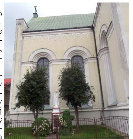
3. Na zdjęciu: dach z blachy miedzianej pokrytej zieloną patyną i figura Matki Bożej Fatimskiej ustawiona w 1979 r. dla upamiętnienia pierwszej wizyty w Polsce papieża Jana Pawła II (fot. Zb. Januszaniec, 2021 r.).

W kronice parafialnej odnotowane zostały problemy z utrzymaniem szczelności dachu pokrytego dachówką ceramiczną pamiętającą bardzo odległe czasy. O kłopotach z dachem i o jego naprawach mówią m.in. zapisy z 1972 i z 1978 r. W 1979 r. problem rozwiązano zastępując starą dachówkę blachą