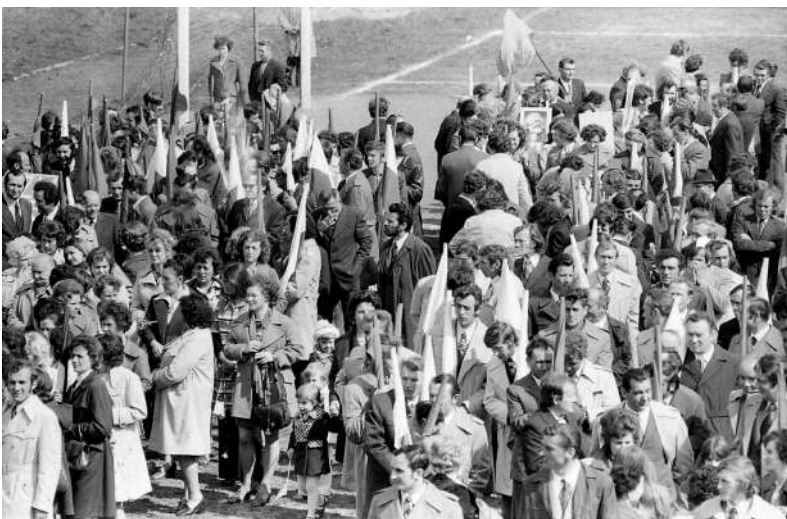
Zbiórka przed pochodem 1-majowym - I połowa lat 70-tych.

Tę datę uznano także jako święto Józefa Robotnika. Świętuje się ją również jako datę wstąpienia do Unii Europejskiej. Nie mam nic przeciwko temu, że ten dzień jest przez niektórych nazywany „świętem grilla”, bo jakby nie było, jest to dzień odpoczynku. W tym czasie wędkarze ruszają na łowy „takich szczupaków”, a działkowcy pielęgnują swoje ogródki. O to właśnie nam chodzi. Czas świętowania się kończy, a my zaś wracamy do naszej szarej polskiej rzeczywistości. Nasi notabie różnych partii uważający się za kontynuatorów ówczesnej opozycji, co chwila mówią o kilkuset, a nawet tysiącach zakładów pracy, które wów-