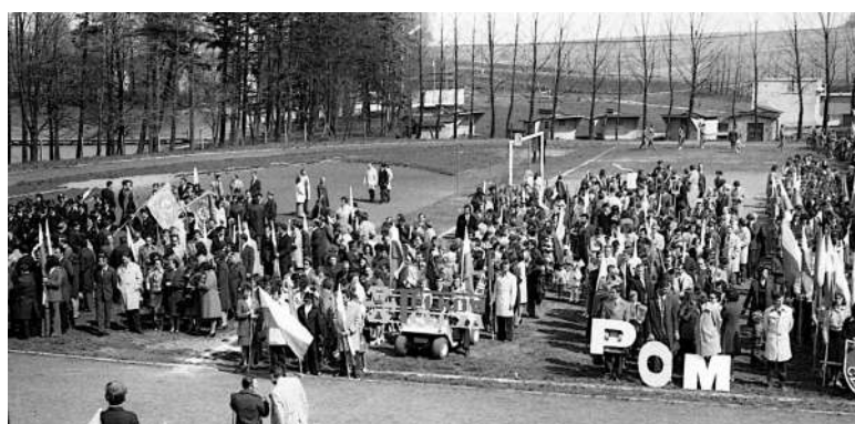
Zbiórka przed pochodem 1-majowym - I połowa lat 70-tych.

Ja nie jestem z tego dumny, że ze wszystkich państw Europy wydajemy najwięcej pieniędzy na zbrojenia, a najmniej na służbę zdrowia, o tym powinniśmy nie tylko mówić, ale wręcz krzyczeć w dniu 1-szego Maja.