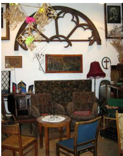
7. Fragment ramy okrągłego okna (tzw. rozety) z „dużego kościoła” wyeksponowany na ścianie czaplineckiej Izby Muzealnej.

kościelnych ścian. Podobno rzeczoznawcy oceniający stan kościelnej budowli budowlani wskazywali na niedoskonałość zastosowanego przez XIX-wiecznych budowniczych rozwiązania konstrukcyjnego wieży dachowej i stropu. Demontaż dzwonnicy według ich oceny był bezwzględnie koniecznością. (link: https://www.dsi.net.pl/archiwum-dzialu-odkrywcy/item/261-zabawagdzie-to-jest-zagadka-nr-35 , dostęp – 10.10.2021).