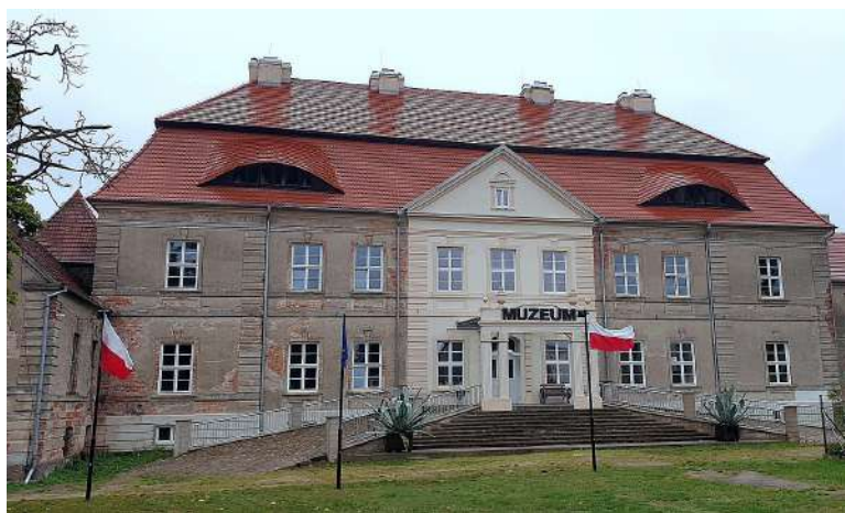
3. Pałac w Siemczynie (stan z września 2021 r.).

Z inicjatywy Henrykowskiego Stowarzyszenia, w Siemczynie powstał Henrykowski Szlak. Początkiem szlaku jest barokowy pałac, od którego wędruje się przez Siemczyno, według mapy i tablic informacyjnych na historycznych budynkach. Zdjęcie nr 3 pochodzące z witryny Pałacu w Siemczynie w serwisie