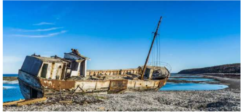
Wysychanie j. Aralskiego

Niedaleko nas, na Wschodzie, jesteśmy świadkami największej katastrofy ekologicznej. Prawie już wyschło Morze Aralskie. To czwar- te pod względem wielkości jezioro na świecie zamienia się w pustynię. Resztki wody wraz ze wzrastającym zasoleniem, zabijają resztki życia. Wyschnięte dno jest toksyczne, a wznoszone tumany skażonego osadu dodatkowo trują. Ci, którzy do tego dopuścili, świadomi byli, że to nastąpi, gdyż ważniejsze dla nich było „białe złoto”, czyli bawełna. Podstawa gospodarki Uzbekistanu, kraju gdzie roczne opady wynoszą średnio ok. 200 mililitrów. Rozprowadzono więc wody rzek Syr-darii i Amu-darii kanałami po polach bawełny. Nazwałbym to zbrodnią przeciwko środowisku, takim ekobójstwem. Specjalnie się temu nawet nie dziwię, bowiem w dawnym ZSRR było sporo niedouczonej Miczurinów. Odradza się życie w części południowej Kazachstanu, a to dlatego, że uległy tam zniszczeniu tamy na Amu-darii.