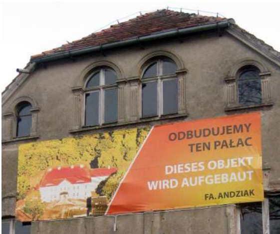
2. Baner z deklaracją odbudowy siemczyńskiego pałacu.

W 2005 r. z inicjatywy właścicieli pałacu powstało Henrykowskie Stowarzyszenie w Siem-