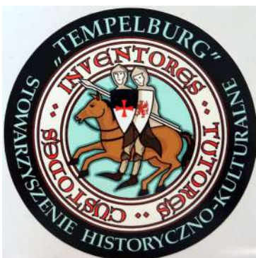
1. Logo SHK „Tempelburg”.

Od 2021 r. Stowarzyszenie organizuje coroczne zloty poszukiwawczy-detektorystów pn. „Tropem Wojsk Szwedzkich”, których głównym celem jest odnalezienie śladów obozu wojsk szwedzkich założonego w okolicach Czaplinka na początku najazdu szwedzkiego, który przeszedł do historii pod nazwą „potopu”. Zloty organizowane we współpracy z Henrykowskim Stowarzyszeniem w Siemczynie zdobyły dużą popularność wśród poszukiwaczy z terenu całego kraju. Fot. nr 1 przedstawia logo SHK „Tempelburg”.