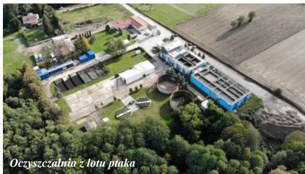
Oczyszczalnia z lotu ptaka

oczyszczalnię ścieków, która zlokalizowana jest w Czaplinku przy ul. Komunalnej w odległości około 1000 m od centrum miasta. Zajmuje teren o powierzchni 1,6471 ha, który stanowi niewielkie wzniesienie ponad poziom j. Drawsko, które jest odbiornikiem oczyszczonych ścieków. Oczyszczalnia została gruntownie zmodernizowana w 2018 r. Modernizacja zrealizowana została przez Gminę Czaplinek przy wsparciu Narodowego Funduszu Ochrony środowiska i Gospodarki Wodnej w ramach działania 2.3 „Gospodarka wodno – ściekowa w aglomeracjach”, II oś priorytetowa „Ochrona środowiska, w tym adaptacja do zmian klimatu” Programu Operacyjnego Infrastruktura i środowisko 2014-20.