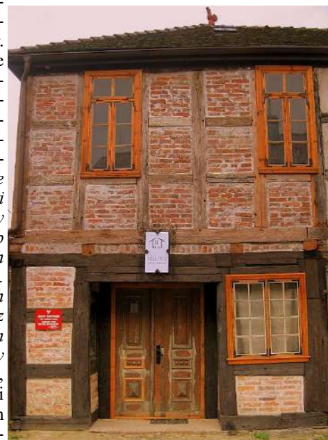
4. Zabytkowy budynek przy ul. Studziennej 2.