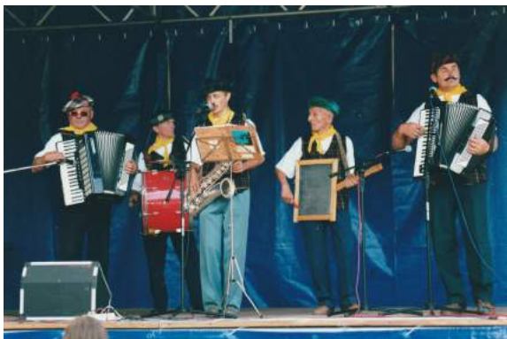
Złocieniec, 2000 r.

M in. to powiedzenie obrazuje głęboki, uniwersalny związek muzyki z życiem człowieka. Do połowy XX wieku macierzystym środowiskiem większości Polaków była wieś, która przez stulecia pieczołowicie przechowywała wielowiekowe, bogate obrzędy i tradycje muzyczne. Muzyka i pieśni towarzyszyły nieustannie naszym przodkom. Nie tylko podczas celebracji świąt, ale również w życiu codziennym, a szczególnie w czasie przełomowych momentów ich egzystencji, takich jak wesela, czy podczas pogrzebów. Ludzie wzrastający i wychowujący się z towarzyszeniem muzyki stali się jej naturalnymi depozytariuszami. Ich potrzeba bycia we wspólnocie oraz dzielenia się z nią swoimi przeżyciami, wspólnej celebracji życia, niejako determinowała ich relacje z ludźmi, a także ścieżki życiowe.