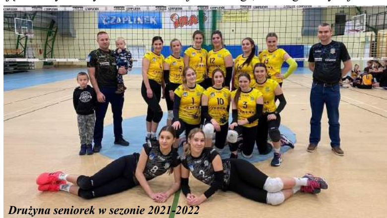
Drużyna seniorek w sezonie 2021-2022

W sezonie 2021/22 przystąpiliśmy do rozgrywek w kategorii juniorek oraz w III lidze kobiet, zaś w 2022 r. będziemy również rywalizować w rozgrywkach mini siatkówki. Nasze zespoły w styczniu zakończyły rozgrywki w wojewódzkiej lidze juniorek. KPS Czaplinek I uplasował się na 2. miejscu zapewniając sobie tym samym awans do turnieju finałowego, zaś druga drużyna juniorek