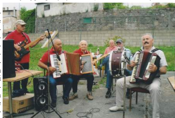
Czaplinek, 20.06.2020 r.