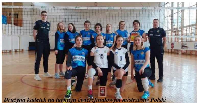
Drużyna kadetek na turnieju ćwierćfinałowym mistrzostw Polski

Niewątpliwie największy sukces w 2021 r. osiągnęły nasze kadetki, które zostały wicemistrzem województwa zachodniopomorskiego awansując tym samym do turnieju ćwierćfinałowego mistrzostw Polski, który rozegraliśmy w Ostrowcu Świętokrzyskim. W nim rywalizowaliśmy z drużynami Energa MKS SMS Kalisz oraz MUKS PASEK Będzin, zaś w meczu o 5. miejsce z zespołem UMKS MIKRO Elk, z którym przegraliśmy plasując się ostatecznie na 6. miejscu w turnieju.