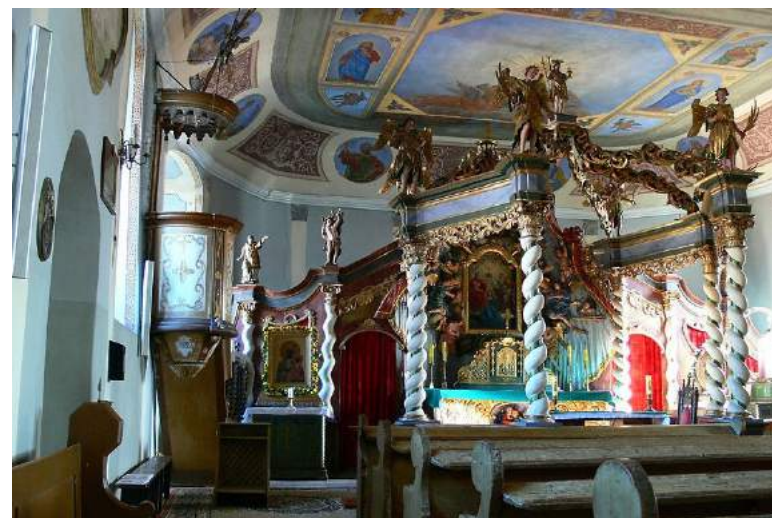
4. Ołtarz baldachimowy w „małym kościele” z widocznym obok ołtarza obrazem Matki Boskiej Częstochowskiej (fot. W. Wiśniewski, 2006 r.)

już gotowi do wyjścia, w naszym mieszkaniu zjawił się znajomy, kościelny czaplineckiego kościoła parafialnego, i prosił gorąco aby obaj chłopcy ponownie służyli o godzinie dwunastej. Moi bracia początkowo zaprotestowali twierdząc, że są umówieni z kolegami, ale kiedy nasza mama stanowczo poparła prośbę