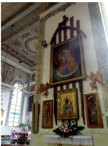
1. Ścienna kompozycja z obrazami w „dużym kościele” (fot. Zb. Januszaniec, 2021 r.)

Bogato zdobiony obraz Matki Boskiej Częstochowskiej wchodzi w skład kompozycji zdobiącej tę ścianę kościelnego skrzydła, w którym znajduje się efektowna rzeźbiarska Grupa Ukrzyżowania autorstwa Edwarda Szatkowskiego. Ścienną kompozycję z obrazami przedstawia fot. nr 1. Jej zasadniczymi elementami są dwa obrazy: duży obraz Matki Boskiej Ostrobramskiej oraz umieszczony pod nim mniejszy obraz Matki Boskiej Częstochowskiej (fot. nr 2), po którego obu stronach umieszczone zostały oszlifowane gabloty z darami wotywnymi (fot. nr 3). Z poprzedniej części artykułu wiemy, że obraz Matki Boskiej Ostrobramskiej był wcześniej umieszczony w nastawie bocznego ołtarza rozebranego przed umieszczeniem w tym miejscu rzeźb Edwarda Szatkowskiego. Również znaczna część darów wotywnych umieszczonych w gablotach widocznych na zdjęciu nr 1 pochodzi z rozebranego ołtarza. A jaka jest historia czaplineckiego obrazu