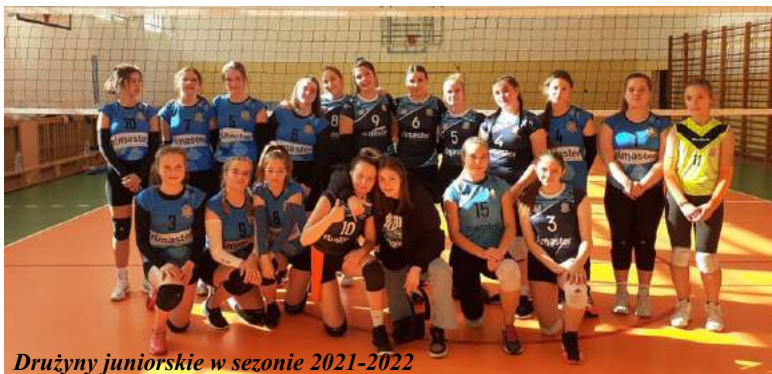
Drużyny juniorskie w sezonie 2021-2022