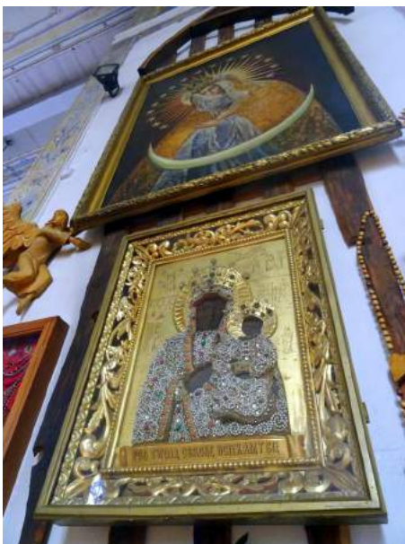
2. Obraz Matki Boskiej Ostrobramskiej i Matki Boskiej Częstochowskiej (fot. Zb. Januszaniec, 2021 r.)

cz. II Trud wrastania” w opisie wydarzeń z 1957 r. znalazłem następujący zapis: 1 maja – wprost niespodziewanie nabywamy obraz matki Boskiej Częstochowskiej, cenny, zabytkowy, malowany na blasze, bogaty w sukienki wyszywane perelkami i kamieniami. Obraz kupujemy we wsi Gawroniec k. Polczyna za sumę 1.900 zł. Wieczorem 1 maja, przed majowym nabożeństwem już go mamy i poświęcamy, aby w czasie triduum do Uroczystości 5 maja patronował nam ze swego tronu ustanowionego w prezbiterium obok wielkiego ołtarza. Jak łatwo zauważyć, powyższy opis – zwłaszcza fragment o „perelkach i kamieniach” zdobiących strój Matki Boskiej bardzo pasuje do wyglądu obrazu znajdującego się w kościele pw. Podwyższenia Krzyża Św. Łatwo możemy to sprawdzić na fotografii nr 2.