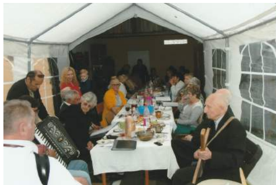
Niwka, lipiec 2017 r.

zmiana. W 1951 r. wieś została przyłączona do ZSRR w ramach powojennej korekty granicy wschodniej Rzeczypospolitej.