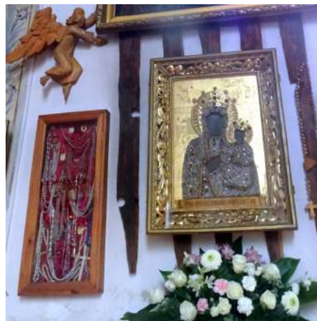
3. Obraz Matki Boskiej Częstochowskiej i gablota z darami wotywnymi

już gotowi do wyjścia, w naszym mieszkaniu zjawił się znajomy, kościelny czaplineckiego kościoła parafialnego, i prosił gorąco aby obaj chłopcy ponownie służyli o godzinie dwunastej. Moi bracia początkowo zaprotestowali twierdząc, że są umówieni z kolegami, ale kiedy nasza mama stanowczo poparła prośbę