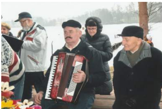
Topienie Marzanny, marzec 2014 r.

Mój rozmówca szybko opanował sztukę fotografii i zaczął samodzielnie zarabiać m.in. dokumentując śluby, chrzciny itp. Pracy miał dużo, stanowczo za dużo - jak twierdził - ponieważ jej ilość uniemożliwiała mu w tamtym czasie zakochanie się. Dodatkowo czas pomiędzy pracą zaczęły mu wypełniać próby w miejscowej orkiestrze strażackiej.