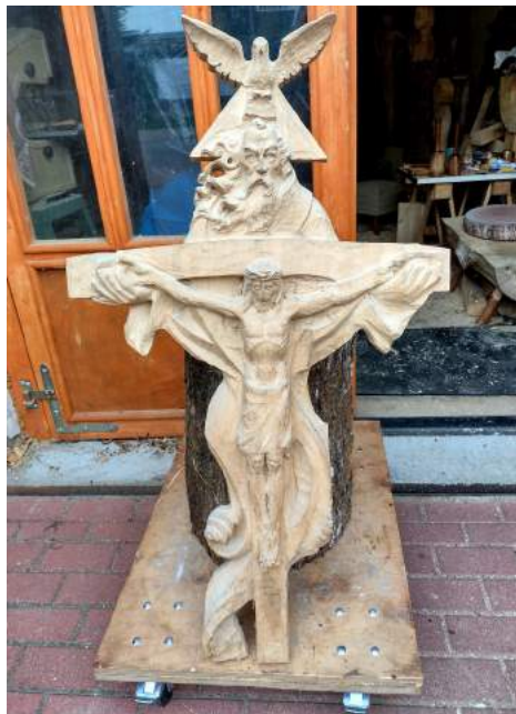
6. Miniatura kompozycji rzeźbiarskiej, która miała być umieszczona w prezbiterium „dużego kościoła”, sfotografowana na tle wejścia do pracowni E. Szatkowskiego

„AVE” nr 4 (65) z 2006 r. opublikowany został wywiad przeprowadzony przez członka redakcji tego czasopisma Janusza Kowalczyka z czaplineckim