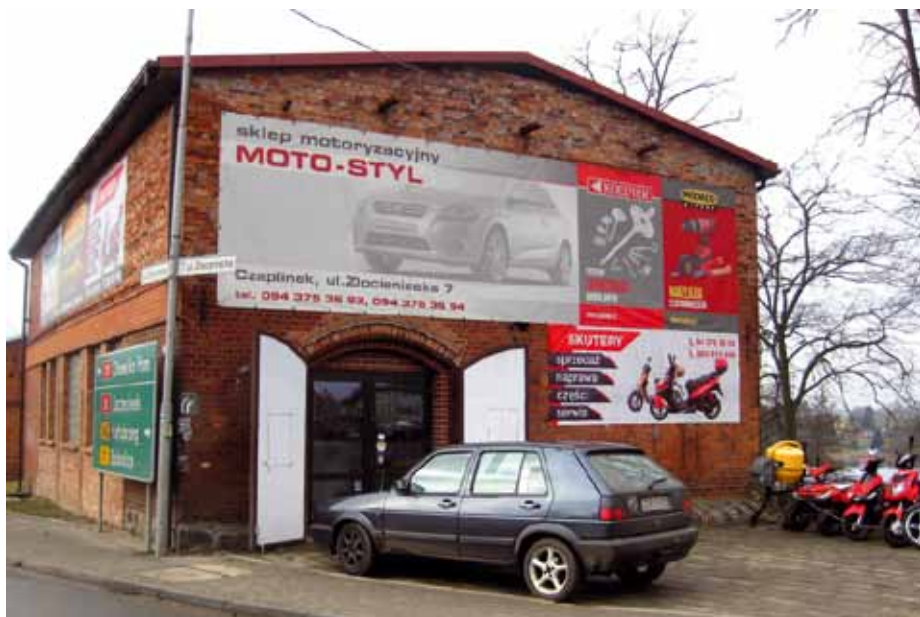
Sklep w dawnej stodole.

z reguły wielokrotnie większym arealem. Są to przeważnie gospodarstwa specjalizujące się w wybranej dziedzinie produkcji rolnej. Gospodarstwa wielokierunkowe należą dziś do rzadkości. Prawie cała hodowla skupia się w specjalistycznych fermach. Są wsie, w których nie ma ani jednej krowy i nikt nie hoduje świń. Duża liczba dawnych małych wielokierunkowych go-