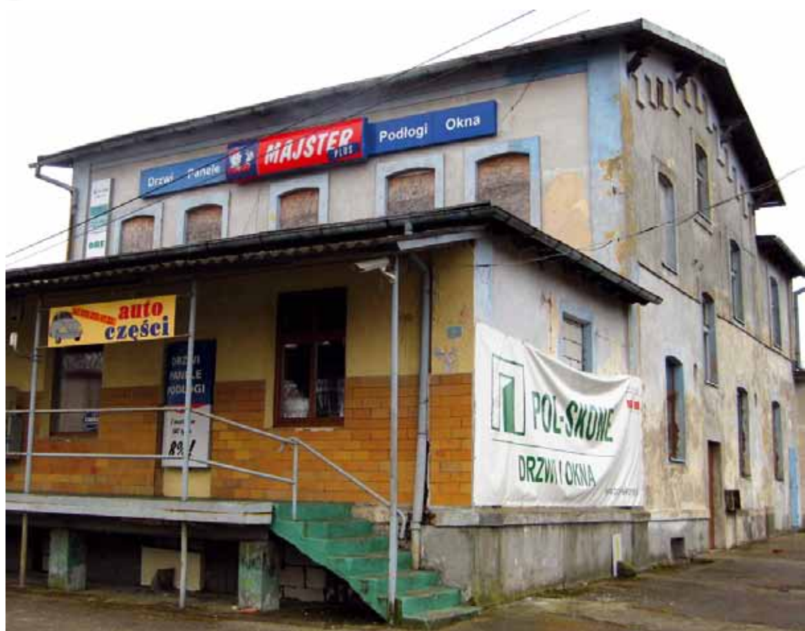
Sklep w dawnej mleczarni.

Lokalne życie gospodarcze aż do pierwszych lat powojennych cechowało wyraźne dążenie do daleko idącej samowystarczalności w zakresie wyżywienia, zarówno w skali gospodarstw domowych, w tym gospodarstw rolnych, jak i w skali lokalnych społeczności, tzn. poszczególnych miejscowości czy też w skali podstawowych jednostek terytorialnych (gmin, gromad). Efektem tego dążenia było duże rozproszenie produkcji żywności. W Czaplinku, podobnie jak w innych miejscowościach, duża część rodzin dysponowała przydomowym ogródkiem lub działką za miastem, gdzie uprawiano warzywa i owoce na własne potrzeby. Nadwyżki