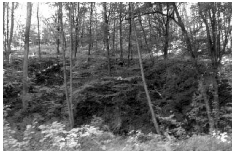
Widok z szosy na jar i drogę ze wzgórza zamkowego w kierunku szlaku solnego

W dalekiej przeszłości prawdopodobnie nie było drogi w miejscu obecnej szosy za krzyżówką z Bolegorzyna do Kluczewa. Od strony Bolegorzyna, na stoku, ku górze, w kierunku pałacu ukosem biegnie nieduży jar. To jest dawna droga. Funkcję obronną pełniła łąka (dawne moczary) po lewej stronie szosy tuż za krzyżówką na Kluczewo. Prawdopodobnie droga z pałacu w kierunku strażnicy była jedna. Biegła przez obniżenie terenu (tam też mogła być jakaś brama), wzgórze (które zaczęto powiększać, żeby wybudować zamek) do strażnicy i dalej przez moczary (być może droga umocniona jakimś balami) w kierunku szlaku solnego. Obecnie widoczne drogi wokół wzgórza zamkowego prawdopodobnie powstały w czasie, gdy zaczęto kopać jary i powiększać wzgórze. Transportowano nimi ziemię z jarów na wzgórze. Po drugiej stronie wzgórza zamkowego