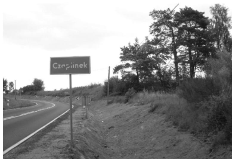
Wyniosłość przy szosie do Szczecinka - domniemana Góra Szubieniczna.